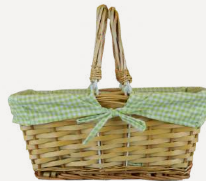
Cesta de Vime Retângular