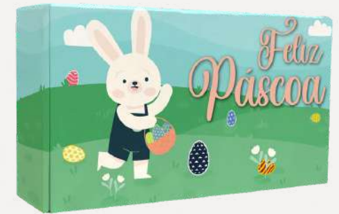
Caixa de Cartão Mini Coelho de Páscoa