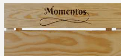
Caixa de Madeira