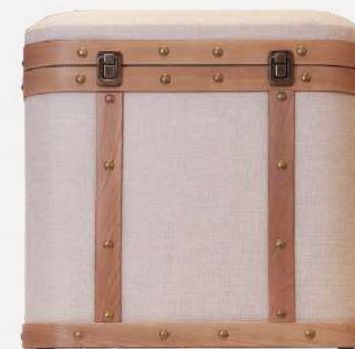
Baú de Madeira Beje