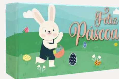
Caixa de Cartão Mini Coelho de Páscoa