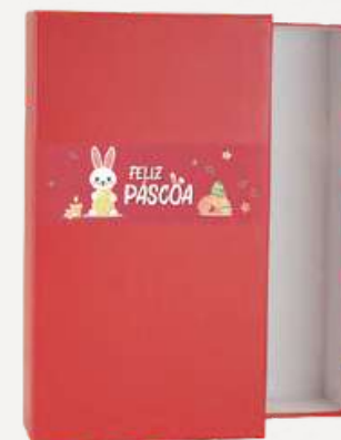
Caixa Exclusiva Vermelha