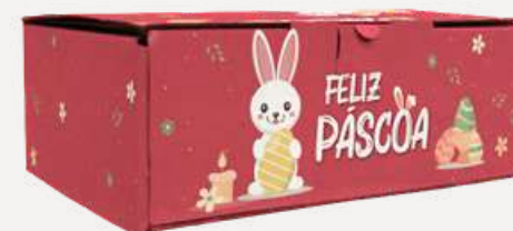
Caixa de Transporte Média