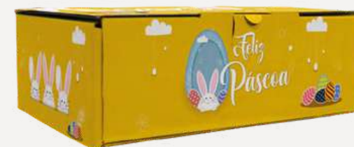
Caixa de Transporte Intermédia