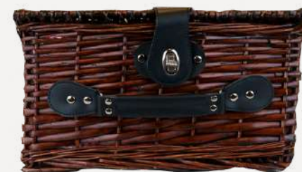
Mala de Vime Quadrada