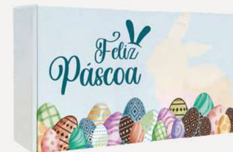
Caixa de Cartão Mini Ovos de Páscoa